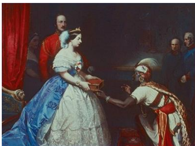
Hình 1: Nữ hoàng Victoria trở thành nữ hoàng Ấn Độ (1877)

+ Chính trị: Chính phủ Anh nắm quyền cai trị trực tiếp Ấn Độ (chế độ trực trị).