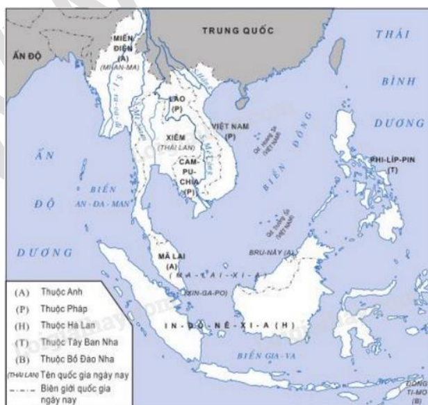
Hình 1: Lược đồ Đông Nam Á cuối thế kỉ XIX- đầu thế kỉ XX

- Xiêm trở thành “vùng đệm” của Anh và Pháp.