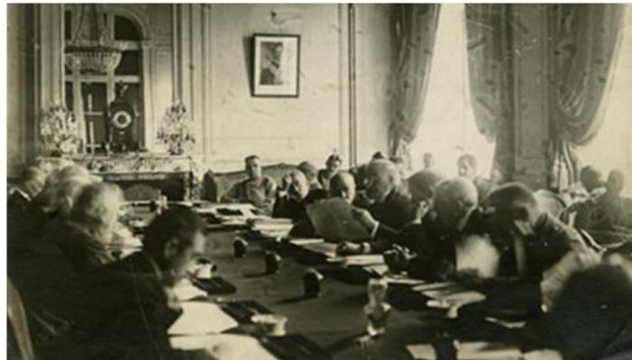
Hình 1: Hội nghị hòa bình ở Véc-xai (1919 – 1920)

- Chiến tranh thế giới thứ nhất kết thúc, các nước tư bản đã tổ chức Hội nghị hòa bình ở Vec-xai (1919- 1920) và Oa-sinh-tơn (1921 - 1922) để kí kết hòa ước, phân chia quyền lợi.