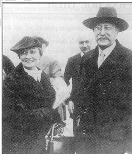
Hình 3: Bơ Lum Lê Ông - Người đứng đầu chính phủ mặt trận nhân dân Pháp 1936

+ 5/1936, Mặt trận nhân dân Pháp giành thắng lợi trong tổng tuyển cử, bảo vệ được nền dân chủ, Pháp thoát khỏi những hiểm họa của chủ nghĩa phát xít.