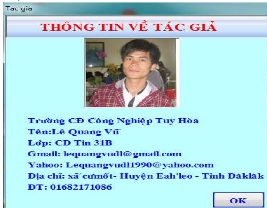
Hình 25 : Thông tin về tác giả