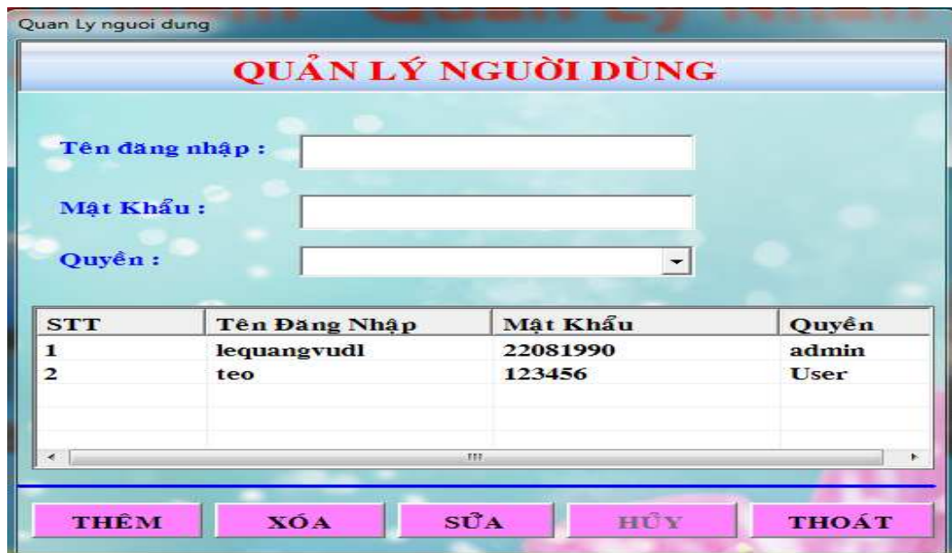
Hình 11: Form quản lý người dùng