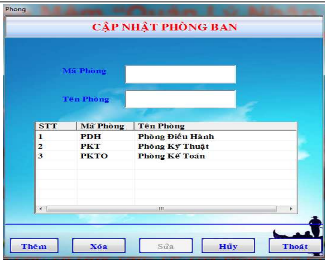
Hình 16: Cập nhật phòng.