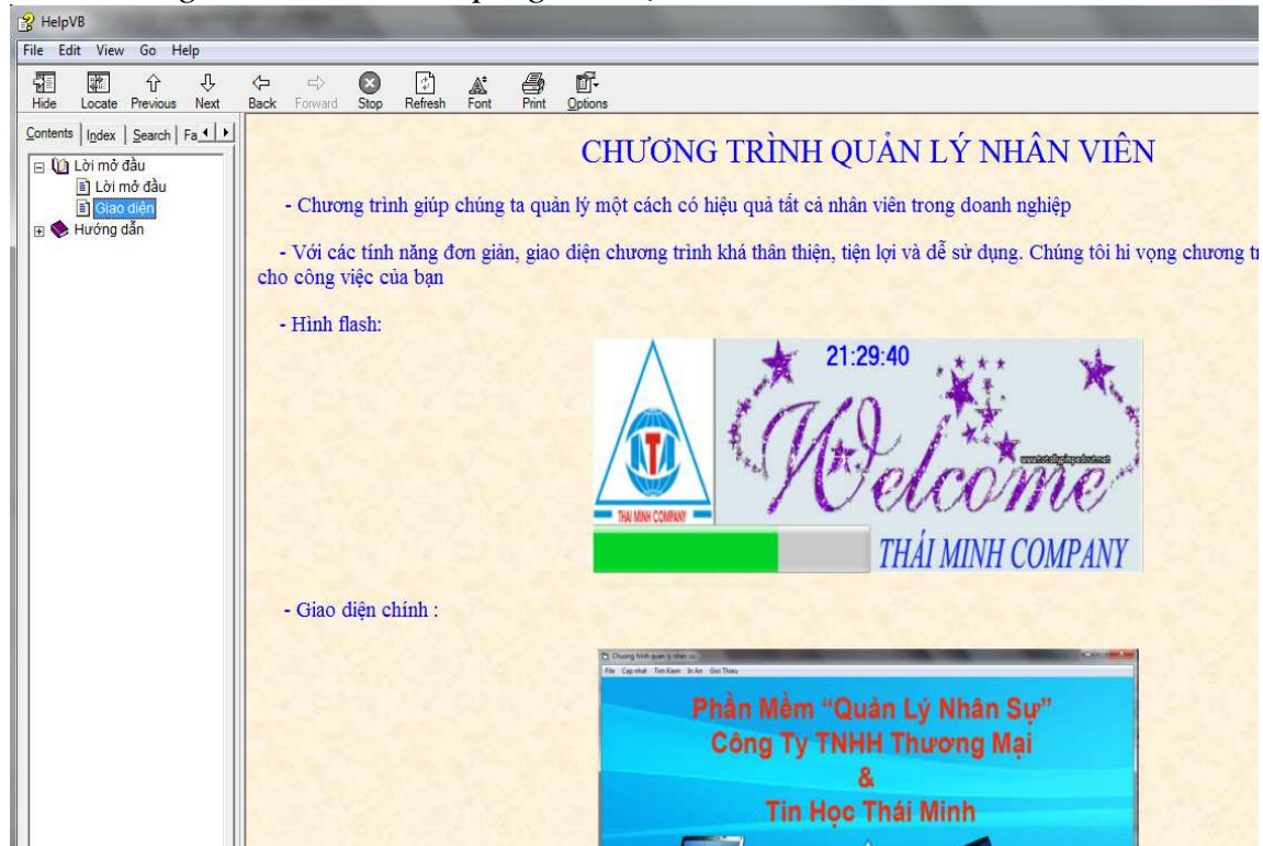
Hình 26 : giao diện help