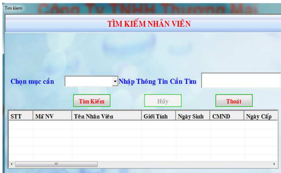
Hình 17: Tìm kiếm nhân viên