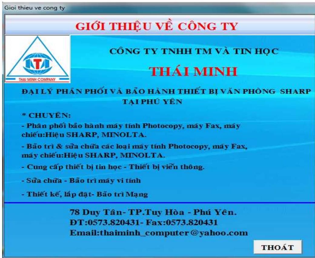
Hình 24: Giới thiệu về công ty