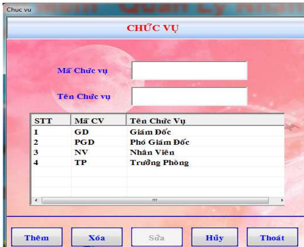
Hình 13: Cập nhật chức vụ