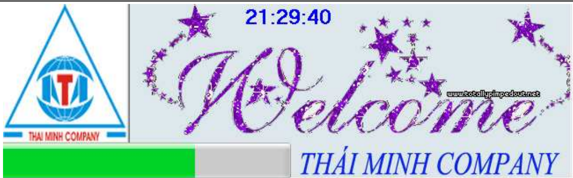
Hình 8: flash