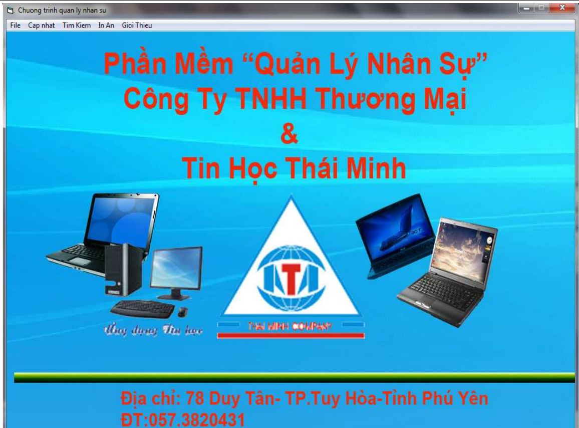
Hình 10: Form chính